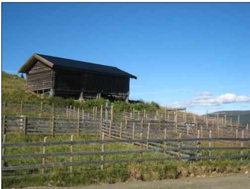
Bilde 5 (t.v.): Sankeanlegg på Børkdalssetra (Foto: MGL).

Vedtak om innvilget tilskudd kan omgjøres og utbetalt tilskudd kan kreves tilbakebetalt dersom det avdekkes forhold som er i strid med det som er forutsatt ved tildeling av tilskuddet. Kommunen kontrollerer at utbetalinger av tilskudd er riktig og har adgang til all bokføring, korrespondanse og opptegnelser som vedkommer tilskuddet.