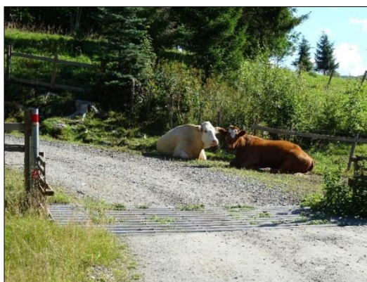
Bilde 3 (t.v.): Sankeanlegg Ramshytta. Bilde 4 (t.h.): Ferist ved Stulen.