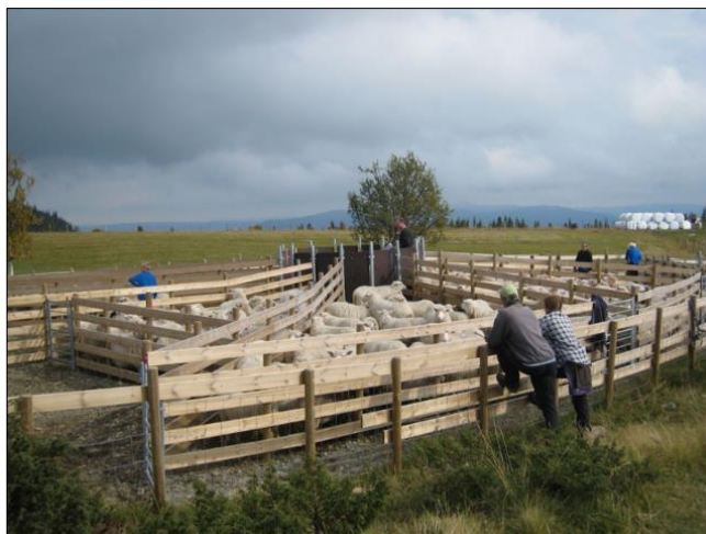
Bilde 2 (t.h.): Nytt sankeanlegg på Myrsetra.