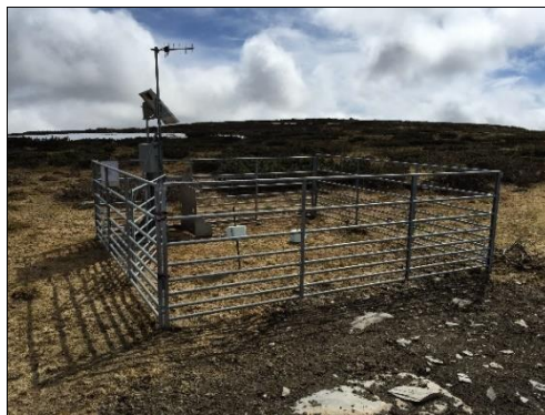
Bilde 6 (t.h.): Saltsteinsavleser.