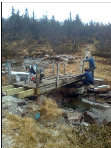
Bilde 1 (t.v.): Bygging av bru over Tverrråa.